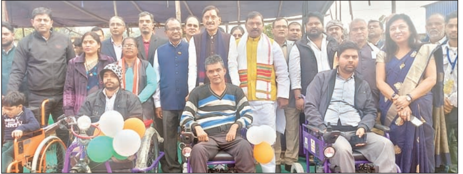
आजाद सिपाही संवाददाता

नामकुम। गेल इंडिया लिमिटेड ने अपने नियमित सामाजिक दायित्व कार्यक्रम के तहत रविवार को सीआरसी नामकुम रांची के सहयोग से दिव्यांगजनों को उपकरण वितरित किये। यह कार्यक्रम सीआरसी नामकुम परिसर में आयोजित किया गया। सर्वप्रथम कार्यक्रम की शुरुआत दीप प्रज्वलित कर अतिथियों ने किया। जहां गेल इंडिया लिमिटेड द्वारा निर्मित उपकरण प्रदान किये गये। इस अवसर पर 86 बैट्री चालित ट्राइसाइकिल, 3 जॉय स्टिक, 49 ट्राइसाइकिल, 18 व्हीलचेयर, 49 वॉकिंग स्टिक, 3 रोलैटर, 22 हिलरिंग एड, 3 सीपी चेर, 5 सुगमा कैन, 3 स्मार्टफोन और 18 टीचिंग एवं लर्निंग किट्स