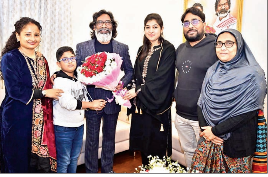
मुख्यमंत्री हेमंत सोरेन से रिवार को कांके रोड रांची स्थित मुख्यमंत्री आवासीय कार्यालय में विधायक निशात आलम और विधायक नीरल पूर्ति एवं उनके परिजनों ने मुलाकात की। मुख्यमंत्री से यह उनकी शिष्टाचार भेंट थी।

भाजपा ने 5628 शक्ति केंद्रों पर सदस्यता अभियान का किया शुभारंभ