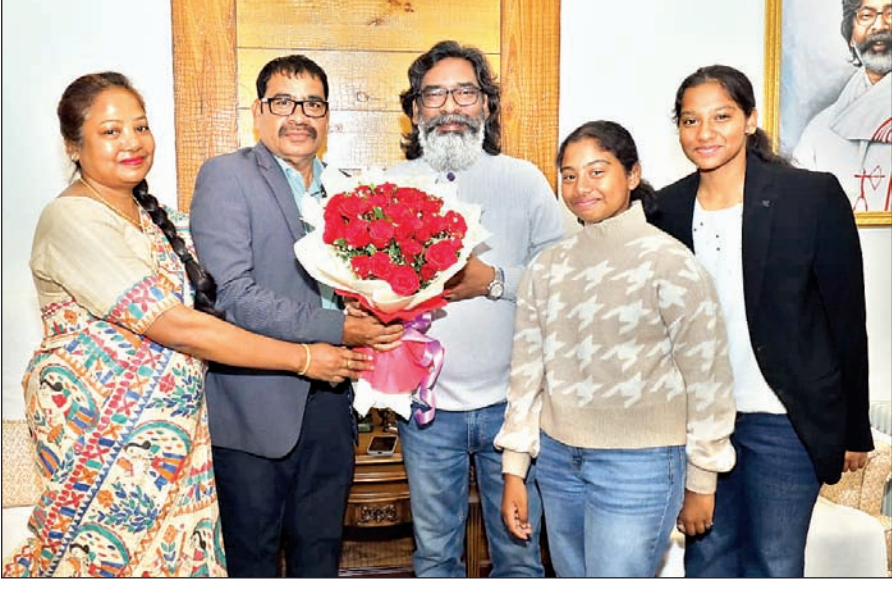
मुख्यमंत्री हेमंत सोरेन से रिवार को कांके रोड रांची स्थित मुख्यमंत्री आवासीय कार्यालय में विधायक निशात आलम और विधायक नीरल पूर्ति एवं उनके परिजनों ने मुलाकात की। मुख्यमंत्री से यह उनकी शिष्टाचार भेंट थी।

मुख्य परीक्षा का रिजल्ट और सेमिनार की जानकारी जल्द ही मैसेज के द्वारा तथा www.gtse.in website पर दे दी जायेगी।