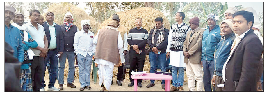
दो पक्षों के विवाद को सुलझाते सामाजिक कार्यकर्तागण।