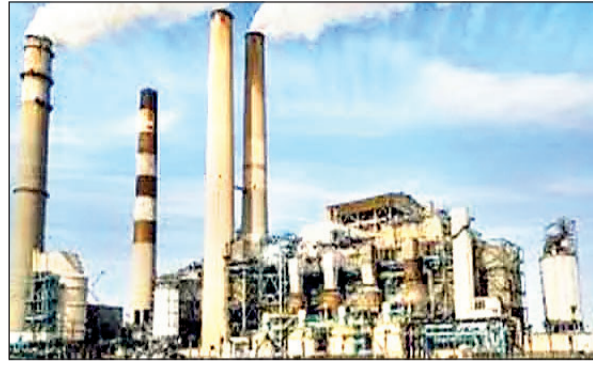
आजाद सिपाही संवाददाता

रांची। झारखंड में अब कॉमर्शियल क्षेत्र के उद्योगों के लिए जमीन खरीदने पर निर्धारित कीमत से 10 गुना ज्यादा राशि चुकानी होगी। वहीं, सेवा क्षेत्र के उद्योगों को जमीन लेते समय निर्धारित मूल्य से 25 प्रतिशत अधिक राशि देनी होगी। झारखंड औद्योगिक क्षेत्र विकास प्राधिकार (जियाडा) ने इससे संबंधित आदेश जारी कर दिया है। जारी आदेश में कहा गया है कि रांची प्रखेत्र अंतर्गत नामकुम, टाटीसिल्वे, तुपुदाना, बरही (हजारीबाग), सिल्क पार्क इरबा, बरहे (चान्हो), सिसई (बुढ़मू), लोहरदगा (एमआइपी), गुमला (एमआइपी), डाल्टनगंज (एमआइपी), गरजा (सिमडेगा), पातागई (घाघरा) और झारगांव (चैनपुर) औद्योगिक क्षेत्रों में अवस्थित रिक्त भूखंडों और शेडों का आवंटन जियाडा करेगी। इच्छुक उद्योगपतियों को भूखंड या शेड लेने के लिए 18 जनवरी तक ऑनलाइन आवेदन कर सकते हैं।