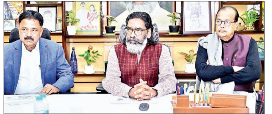
पोर्टल और मोबाइल एप के लोकार्पण के मौके पर सीएम हेमंत सोरेन, वित्त मंत्री राधाकृष्ण किशोर और नगर विकास मंत्री सुदिव्य कुमार।

2025-26 के बजट को लेकर विशेषज्ञ और आम लोग दे सकेंगे अपना सुझाव