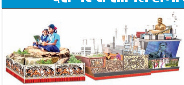
केंद्र सरकार ने सभी राज्यों और केंद्र शासित प्रदेशों से झांकियों का प्रारूप मांगा था। विभिन्न चरणों की चयन प्रक्रिया के उपरांत केवल 15 राज्यों

स्वर्गाय रतन टाटा को श्रद्धांजलि के साथ झारखंड की समृद्ध संस्कृति, यहां के पारंपरिक नृत्य, शिक्षा में नारी शक्ति के बढ़ते कदम आदि को प्रदर्शित किया जायेगा। बता दें कि 2024 में