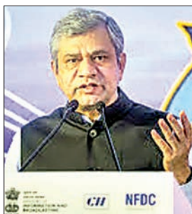
मॉनिटरिंग प्लेटफॉर्म स्तर से लेकर रेलवे बोर्ड स्तर तक की जायेगी।