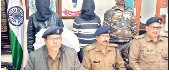
पकड़े गये नक्सलियों के बारे में जानकारी देते पुलिस के आला अधिकारी।