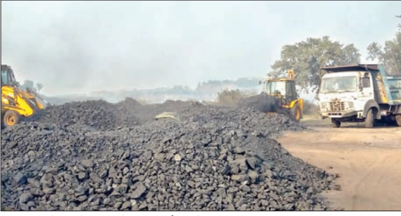
हिंसा मामले में कुल सात मामले हुए हैं दर्ज, सांसद के खिलाफ भी एफआइआर, महिला सहित दो हिरासत में