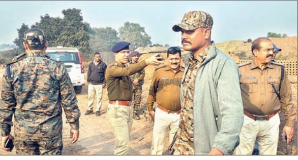
हिलटॉप आउटसोर्सिंग हिंसा मामले में छापामारी कर जांच करते पुलिस के आला अधिकारी। आरोपित के पास से जब्त अवैध कोयला।