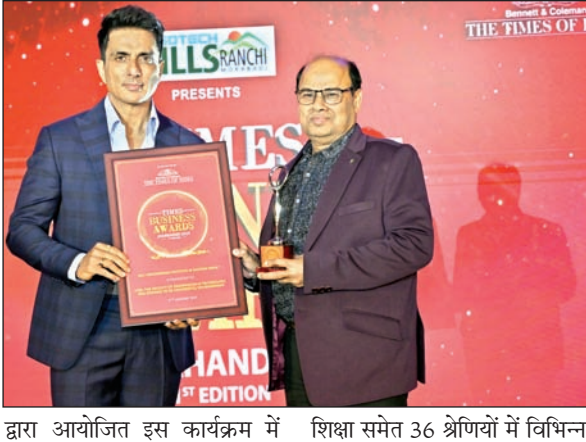
द्वारा आयोजित इस कार्यक्रम में शिक्षा समेत 36 श्रेणियों में विभिन्न

भुवनेश्वर। एजुकेशन एंड रिसर्च (सोआ) द्वारा संचालित इंस्टीट्यूट ऑफ टेक्निकल एजुकेशन एंड रिसर्च (आइटीइआर) को प्रथम टाइम्स बिजनेस अवार्ड-झारखंड 2025 में पूर्व भारत में नंबर वन इंजीनियरिंग शैक्षणिक संस्थान के रूप में सम्मानित किया गया है। 17 जनवरी को टाइम्स ऑफ इंडिया