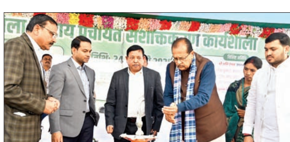
पंचायत सशक्तिकरण कार्यशाला का उद्घाटन करते वित्त मंत्री, डीसी व अन्य।

मेदिनीनगर। राज्य के वित्त, वाणिज्यकर, योजना, विकास एवं संसदीय कार्य विभाग के मंत्री राधा कृष्ण किशोर ने कहा कि किसी भी राज्य या जिले के विकास के लिए जरूरी है कि वहां की शिक्षा व्यवस्था सुदृढ़ हो। यह तभी संभव होगा जब आपके क्षेत्र में संचालित प्राथमिक पाठशाला सुचारू रूप से बच्चों को शिक्षित करें। क्योंकि प्राथमिक पाठशाला से ही शिक्षा की नींव पड़ती है। इस नींव को मजबूत करने में आप सभी पंचायत के जनप्रतिनिधियों की अहम भूमिका है। वित्त मंत्री शुक्रवार को सतबरवा के मलय डैम में आयोजित जिला स्तरीय पंचायत सशक्तिकरण कार्यशाला में बोल रहे थे। उन्होंने कार्यक्रम में उपस्थित सभी जनप्रतिनिधियों से