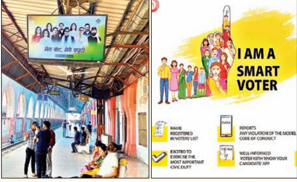
नयी दिल्ली/भुवनेश्वर। राष्ट्रीय मतदाता दिवस पर भारतीय रेल को बेस्ट इलेक्टोरल प्रैक्टिस अवार्ड-2024-25 प्रदान किया जायेगा। यह आयोजन 25 जनवरी को नयी दिल्ली के कैटोनमेंट स्थित मानेकशा सेंटर में होने वाला है। 2024 के लोकसभा चुनावों में भारतीय रेल ने मतदाता जागरूकता और लॉजिस्टिक सहयोग में महत्वपूर्ण भूमिका निभाई है, जिसके लिए भारत निर्वाचन आयोग द्वारा यह पुरस्कार दिया जा रहा है। स्टेशनों पर पूर्व-रिकॉर्डेड घोषणाएं की गयीं, जिनमें मतदान की अहमियत और प्रक्रिया की जानकारी दी गयी। इस दौरान 3,74,000 से अधिक अर्धसैनिक बलों को 383 विशेष ट्रेनों के माध्यम से देशभर में सुरक्षित और समय पर पहुंचाने का काम किया। सोशल मीडिया अभियान और जनभागीदारी भारतीय रेल ने मतदाता जागरूकता बढ़ाने के लिए सोशल मीडिया प्लेटफॉर्मों का भी बेहतर तरीके से उपयोग किया। भारतीय रेल ने न केवल मतदान प्रक्रिया को सुगम बनाने का काम किया, बल्कि नागरिक भागीदारी को बढ़ावा देकर लोकतंत्र की जड़ों को और मजबूत किया। यह पुरस्कार भारतीय रेल की उन असाधारण पहलों का प्रतीक है, जो यह दर्शाती हैं कि रेलवे केवल परिवहन का साधन नहीं, बल्कि राष्ट्र के लोकतांत्रिक ढांचे का अभिन्न हिस्सा है।