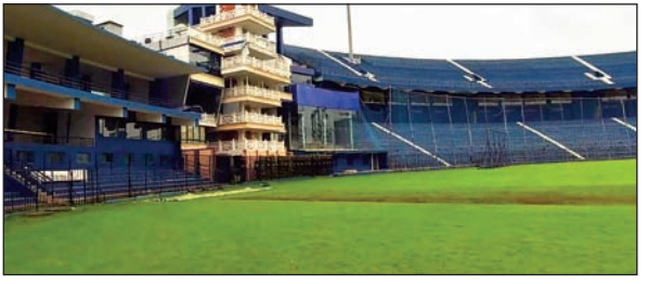
आजाद सिपाही संवाददाता

भुवनेश्वर। भारत-इंग्लैंड वनडे क्रिकेट मैच 9 फरवरी को कटक के बारबाटी में होगा। ऑनलाइन टिकटों की बिक्री 2 फरवरी से शुरू होगी। कुल 4 हजार टिकट ऑनलाइन मोड में बेचे जायेंगे। ऑनलाइन बुकिंग की हार्ड कॉपी कैब्रिज स्कूल भुवनेश्वर और क्विंट यूनिवर्सिटी भुवनेश्वर के कैम्पस काउंटर से ले सकते हैं। काउंटर दो दिन 7-8 तारीख को सुबह 10 बजे से शाम 4 बजे तक खुला रहेगा। 9 तारीख को सुबह 7 बजे से दोपहर 12 बजे तक काउंटर खुला रहेगा। इन दोनों स्थानों में से प्रत्येक पर तीन काउंटर होंगे। 3 और 4 फरवरी को संबद्ध क्लबों को टिकट बेचे जायेंगे। आम जनता के लिए टिकट 5 और 6 फरवरी को बेचे जायेंगे। पुलिस आयुक्त और मुख्य अग्निशमन अधिकारी ने स्टेडियम की स्थिति का निरीक्षण किया। भारत-इंग्लैंड वनडे क्रिकेट मैच को देखने के लिए 50 हजार दर्शक होने वाली है। ऐसे में पुलिस कमिश्नर ने इस बात पर जोर दिया कि कैसे स्टेडियम परिसर में अनुशासन बनाये रखा जायेगा और टिकटों की बिक्री में कोई समस्या नहीं होगी। खिलाड़ियों और दर्शकों की सुरक्षा के साथ-साथ यातायात प्रबंधन पर भी विशेष ध्यान दिया जायेगा। पार्किंग स्थलों पर सीसीटीवी लगाये जायेंगे।