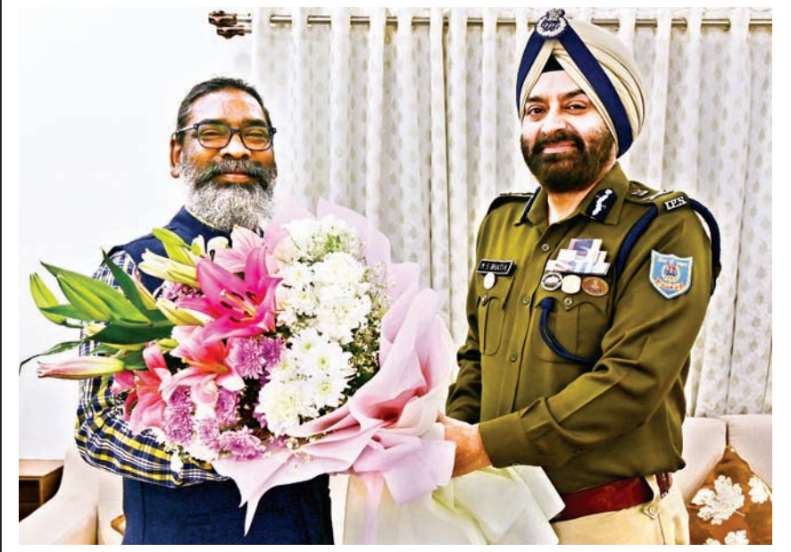
मुख्यमंत्री हेमंत सोरेन ने शुक्रवार को कांके रोड रांची स्थित मुख्यमंत्री आवासीय कार्यालय में आइपीएस अधिकारी एमएस भाटिया ने मुलाकात की। मुख्यमंत्री से यह उनकी शिष्टाचार भेंट थी। वह केंद्रीय प्रतिनिधित्व से झारखंड लौटे