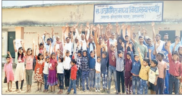
स्कूल के बाहर विरोध प्रदर्शन करते ग्रामीण, अभिभावक व स्कूली बच्चे।

हरिहरगंज/पलामू। प्रखंड के सलेया पंचायत अंतर्गत रब्दी भंवरहा राजकीय उच्चमिड मध्य विद्यालय में सरस्वती पूजा नहीं मनाए जाने पर सोमवार को ग्रामीणों और विद्यार्थियों में काफी आक्रोश दिखा। प्रधानाध्यापक पर कई आरोप भी लगाए गए। हालांकि प्रधानाध्यापक और शिक्षक विद्यालय