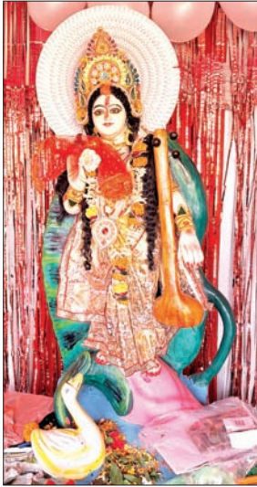
बेरमो और धनबाद कोयलांचल में आयोजित पूजा पंडालों में उमड़े लोग व जगह-जगह स्थापित मां सरस्वती की पूजा।

फुसरो/पिछरी/आइडल/बेरमो/धनबाद/झरिया। बसंत पंचमी के अवसर पर बेरमो कोयलांचल में सरस्वती पूजा धूमधाम के साथ मनाया जा रहा है। सुबह से ही बच्चे और विद्यार्थी मां सरस्वती के सामने नतमस्तक दिखे। विभिन्न सरकारी और गैर सरकारी स्कूल, कॉलेज, क्लबों आदि स्थानों पर पूजा की धूम रही। सभी स्कूल-कॉलेज में मां सरस्वती की प्रतिमा स्थापित कर पूजा की गयी। इन्ड्र सिंह महिला कॉलेज, अनपति देवी सरस्वती शिशु विद्या मंदिर, कस्तूरबा श्री विद्या निकेतन, सरस्वती शिशु विद्या मंदिर, दोरी, रामरतन हाई स्कूल, आदर्श मध्य विद्यालय दोरी, भरत सिंह पब्लिक स्कूल सहित सभी स्कूलों-कॉलेजों और कोचिंग सेंटरों में मां शारदे की प्रतिमा रख पूरे विधि विधान के साथ पूजन किया गया। कस्तूरबा श्री विद्या निकेतन, अनपति देवी सरस्वती शिशु विद्या मंदिर एवं सरस्वती शिशु विद्या मंदिर दोरी में सरस्वती पूजा के अवसर पर नये नामांकन के लिए छोटे-छोटे बच्चों का विद्यार्थ संस्कार विधिपूर्वक किया गया। इसके अलावा मां सरस्वती की भव्य प्रतिमा अलग-अलग इलाकों में स्थापित की गई है। इसके लिए छोटे-छोटे पंडालों का भी निर्माण किया गया है। मां सरस्वती को आकर्षक ढंग से सजाया गया है। वर्षों से चली आ रही परंपरा आज भी उत्तरे ही उत्साह और भक्ति के साथ मनाई जाती है। स्कूल के साथ साथ बच्चे अपने-अपने गली मोहल्लों