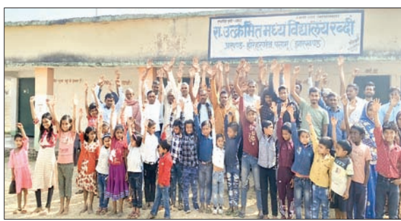
स्कूल के बाहर विरोध प्रदर्शन करते ग्रामीण, अभिभावक और स्कूली बच्चे।

हरिहरगंज/पलामू। प्रखंड के सलैया पंचायत अंतर्गत रब्दी बंवारहा राजकीय उत्कृष्टत मध्य विद्यालय में सरस्वती पूजा नहीं मनाये जाने पर सोमवार को ग्रामीणों और विद्यार्थियों में काफी आक्रोश दिखा। प्रधानाध्यापक पर कई आरोप भी लगाये गये। हालांकि प्रधानाध्यापक और शिक्षक