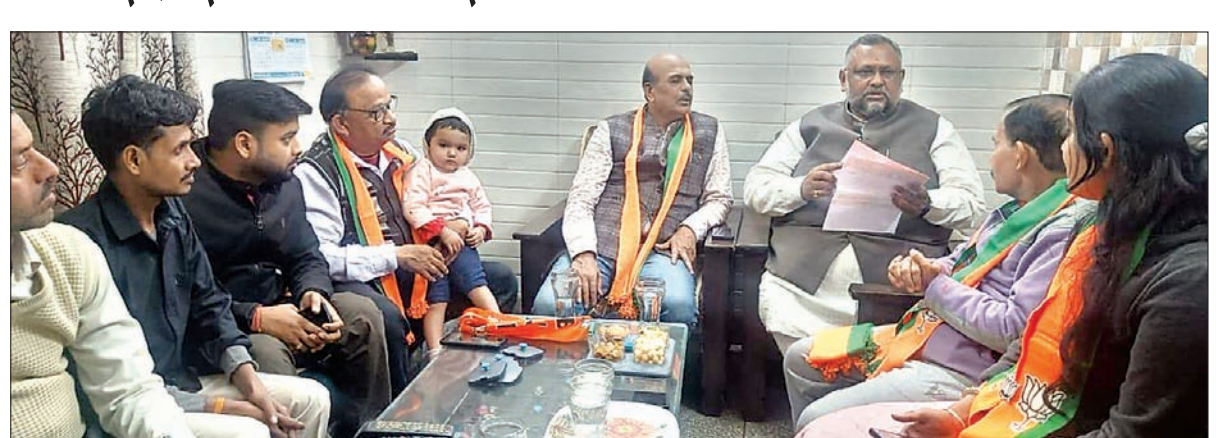
दिल्ली विधानसभा चुनाव के निमित्त शाहदरा विधानसभा के दिलशाद कॉलोनी के बुथ नंबर-130 और 151 में सोमवार को जनसंपर्क कर आगामी 5 फरवरी को इवीएम के क्रम संख्या 4 पर कमल के बटन को दबाकर भाजपा को भारी मतों से विजयी बनाने की अपील की।