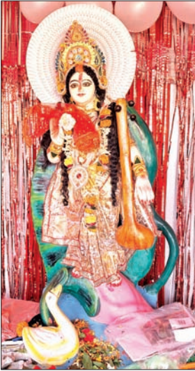
बेरमो और धनबाद कोयलांचल में आयोजित पूजा पंडालों में उमड़े लोग व जगह-जगह स्थापित मां सरस्वती की पूजा।

फुसरो/पिछरी/आइडल/बेरमो/धनबाद/झरिया। बसंत पंचमी के अवसर पर बेरमो कोयलांचल में सरस्वती पूजा धूमधाम के साथ मनाया जा रहा है। सुबह से ही बच्चे और विद्यार्थी मां सरस्वती के सामने नतमस्तक दिखे। विभिन्न सरकारी और गैर सरकारी स्कूल, कॉलेज, क्लबों आदि स्थानों पर पूजा की धूम रही। सभी स्कूल-कॉलेज में मां सरस्वती की प्रतिमा स्थापित कर पूजा की गयी। इन्ड्र सिंह महिला कॉलेज, अनपति देवी सरस्वती शिशु विद्या मंदिर, कस्तूरबा श्री विद्या निकेतन, सरस्वती शिशु विद्या मंदिर, दोरी, रामरतन हाई स्कूल, आदर्श मध्य विद्यालय दोरी, भरत सिंह पब्लिक स्कूल सहित सभी स्कूलों-कॉलेजों और कोचिंग सेंटरों में मां शारदे की प्रतिमा रख पूरे विधि विधान के साथ पूजन किया गया। कस्तूरबा श्री विद्या निकेतन, अनपति देवी सरस्वती शिशु विद्या मंदिर एवं सरस्वती शिशु विद्या मंदिर दोरी में सरस्वती पूजा के अवसर पर नये नामांकन के लिए छोटे-छोटे बच्चों का विद्यार्थ संस्कार विधिपूर्वक किया गया। इसके अलावा मां सरस्वती की भव्य प्रतिमा अलग-अलग इलाकों में स्थापित की गई है। इसके लिए छोटे-छोटे पंडालों का भी निर्माण किया गया है। मां सरस्वती को आकर्षक ढंग से सजाया गया है। वर्षों से चली आ रही परंपरा आज भी उत्तरे ही उत्साह और भक्ति के साथ मनाई जाती है। स्कूल के साथ साथ बच्चे अपने-अपने गली मोहल्लों