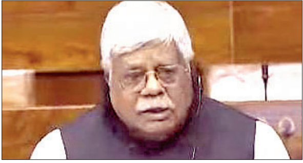
पलामू सांसद विष्णु दयाल राम।

मेदिनीनगर। पलामू सांसद विष्णु दयाल राम ने मंगलवार को नियम 377 के तहत पलामू संसदीय क्षेत्र अंतर्गत मेदिनीनगर के चियांकी एयरपोर्ट के विस्तार एवं विमान का परिचालन शुरू करने संबंधी मामले को उठाया। सांसद ने कहा कि चियांकी एयरपोर्ट क्षेत्रीय संपर्क योजना के अंतर्गत उड़ान योजना में सम्मिलित किया गया है। पर राज्य सरकार की उदासीनता के कारण विमान का परिचालन शुरू नहीं हो पा रहा है। विदित हो कि