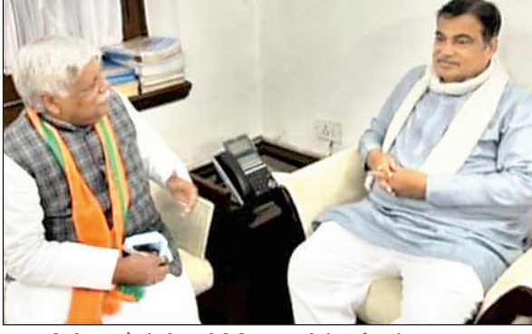
सांसद विडी राम और केंद्रीय मंत्री नितिन गडकरी से चर्चा करते हुए।

गढ़वा। सांसद विष्णु दयाल राम ने नयी दिल्ली में सड़क परिवहन और राजमार्ग मंत्रालय, भारत सरकार के मंत्री नितिन गडकरी से मुलाकात कर पलामू संसदीय क्षेत्र के अंतर्गत एनएचआई के द्वारा एनएच 75 और 98 का फोरलेन निर्माणधीन सड़कों का कार्यों के संबंध में विस्तृत चर्चा किया। इस अवसर पर गढ़वा फोरलेन बाईपास सड़क और पलामू जिला के सीलीदास से हरिहरगंज तक एनएच 98 को फोरलेन सड़क का निर्माण कार्य लगभग पूर्ण होने वाला है। उक्त दोनों परियोजनाओं का उद्घाटन मार्च-अप्रैल महीने में करने का अनुरोध किया, जिसपर मंत्री ने जल्द समय निर्धारित करने को कहा है। साथ ही साथ गढ़वा से मझिआंव, कांडी होते हुए श्रीनगर (झारखंड) एवं पंडुका (रोहतास, बिहार) रा0रा0 119 तक नया राष्ट्रीय राजमार्ग घोषित किया जाय। इसके निर्माण हो जाने से बिहार का झारखंड तथा छत्तीसगढ़ से कनेक्टिविटी और मजबूत होगी। दक्षिण बिहार के इलाके का सीधा संपर्क झारखंड के कई शहरों से हो सकेगा। इससे उत्तर प्रदेश, मध्यप्रदेश, छत्तीसगढ़, बिहार एवं देश के अन्य राज्यों से झारखंड की अर्थव्यवस्था सुदृढ़ होगी तथा नये अवसर प्राप्त होंगे, जिससे लोगों की बेरोजगारी दूर होगी।