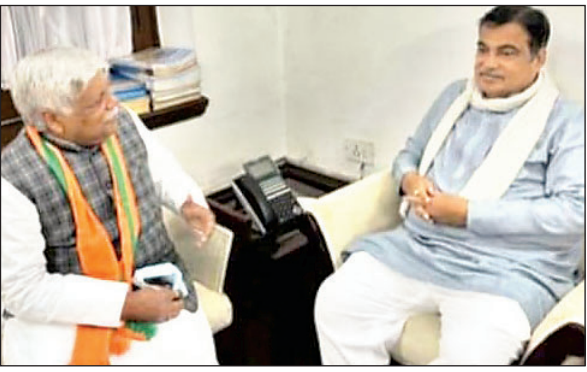
सांसद विडी राम और केंद्रीय मंत्री नितिन गडकरी से चर्चा करते हुए।

गढ़वा। सांसद विष्णु दयाल राम ने नयी दिल्ली में सड़क परिवहन और राजमार्ग मंत्रालय, भारत सरकार के मंत्री नितिन गडकरी से मुलाकात कर पलामू संसदीय क्षेत्र के अंतर्गत एनएचआई के द्वारा एनएच 75 और 98 का फोरलेन निमाणाधीन सड़कों का कार्यों के संबंध में विस्तृत चर्चा किया। इस अवसर पर गढ़वा फोरलेन बाईपास सड़क और पलामू जिला के सीलीदास से हरिहरगंज तक एनएच 98 को फोरलेन सड़क का निर्माण कार्य लागू पूर्ण होने वाला है। उक्त दोनों परियोजनाओं का उद्घाटन मार्च-अप्रैल महीने में करने का अनुरोध किया, जिसपर मंत्री ने जल्द समय निर्धारित करने को कहा है। साथ ही साथ गढ़वा से मझिआंव, कांडी होते हुए श्रीनगर (झारखंड) एवं पंडुका (रोहतास, बिहार) रा0रा0 119 तक नया राष्ट्रीय राजमार्ग घोषित किया जाय। इसके निर्माण हो जाने से बिहार का झारखंड तथा छत्तीसगढ़ से कनेक्टिविटी और मजबूत होगी। दक्षिण बिहार के इलाके का सीधा संपर्क झारखंड के कई शहरों से हो सकेगा। इससे उत्तर प्रदेश, मध्यप्रदेश, छत्तीसगढ़, बिहार एवं देश के अन्य राज्यों से झारखंड की अर्थव्यवस्था सुदृढ़ होगी तथा नये अवसर प्राप्त होंगे, जिससे लोगों की बेरोजगारी दूर होगी।