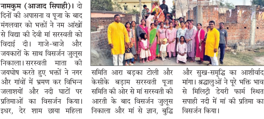
समिति आरा बड़का टोली और केसीके बड़मा सरस्वती पूजा समिति की ओर से मां सरस्वती की आरती के बाद विसर्जन जुलूस निकाला और मां से ज्ञान, बुद्धि और सुख-समृद्धि का आशीर्वाद मांगा। श्रद्धालुओं ने पूरे भक्ति भाव से मिलिट्री डेयरी फार्म स्थित सपाही नदी में मां की प्रतिमा को विसर्जन किया।

नामकुम (आजाद सिपाही)। दो दिनों की अपासना व पूजा के बाद मंगलवार को भक्तों ने नम आंखों से विद्या की देवी मां सरस्वती को विदाई दी। गाजे-बाजे और जयकारों के साथ विसर्जन जुलूस निकाला। सरस्वती माता की जयघोष करते हुए भक्तों ने नगर और गांवों में भ्रमण कर विभिन्न जलाशयों और नदी घाटों पर प्रतिमाओं का विसर्जन किया। इधर, देर शाम छाया महिला