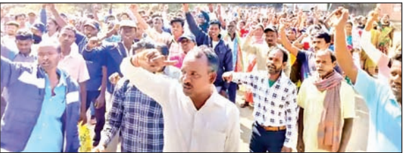
धरना पर बैठ गये, जिससे आना जाना बंद हो गया।

पोटका। प्रखंड के रसुनचोपा पंचायत के जन वितरण प्रणाली दुकानदार द्वारा सैकड़ों कार्डधारियों को पांच माह का खाद्यान्न नहीं उपलब्ध कराये जाने से नाराज कार्डधारियों ने मंगलवार को पोटका मुख्यालय में जोरदार प्रदर्शन करते हुए प्रखंड मुख्यालय को पांच घंटे घेरे रखा। रसुनचोपा पंचायत के बुरुहाट्ट, लोवाडीह, गालूसिंगी, सिकीडिया, सावनाडीह, सारसे, लेंगाडीह, कुड़तापुट्ट, धोपासाई एवं कोरगाटोला के सैकड़ों ग्रामीण पोटका चौक से रैली निकाल प्रखंड मुख्यालय पहुंचे एवं पांच माह का खाद्यान्न नहीं मिलने की बात कह मुख्यालय के मुख्य द्वार पर प्रदर्शन करते हुए