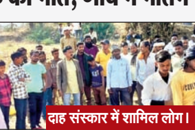
दाह संस्कार में शामिल लोग।

हृदयगति रुकने से युवक की मौत, गांव में मातम