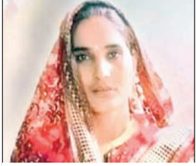
विवाहिता की फाइल फोटो।

पुलिस ने पति, ससुर तथा नैसुर को हिरासत में लेकर सभी पहलुओं पर जांच शुरू की महिला ने एक दिन पूर्व गढ़वा महिला थाना में पति तथा ससुराल वालों पर मारपीट करने का आरोप लगाते हुए ग्याव की गुहार लगायी थी