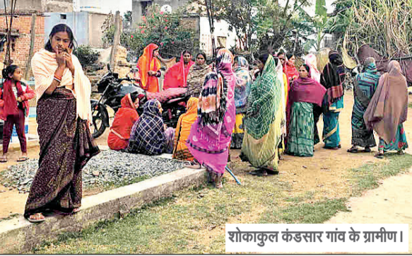
शोकाल कंडसार गांव के ग्रामीण।

आजाद सिपाही संवाददाता हजारीबाग। हजारीबाग जिले के कटकमसांडी प्रखंड के कंडसार गांव से कुंभ स्नान के लिए निकले श्रद्धालुओं का जथा एक दर्दनाक हादसे का शिकार हो गया। यह दुर्घटना उत्तर प्रदेश के जौनपुर जिले के बदलापुर थाना क्षेत्र में हुई, जिसमें 11 लोगों से भरी गाड़ी दुर्घटनाग्रस्त हो गयी। प्रारंभिक सूचना के अनुसार इस हादसे में 6 लोगों की मौके पर ही मृत्यु हो गयी, जबकि 5 गंभीर रूप से घायल हैं, जिनका इलाज स्थानीय तथा वाराणसी के अस्पताल में चल रहा है। हजारीबाग से निकले श्रद्धालु कुंभ स्नान करने के बाद अयोध्या में श्रीराम जन्मभूमि का दर्शन कर रहे थे। अयोध्या दर्शन के उपरांत, वे जौनपुर के रास्ते होते हुए हजारीबाग लौट रहे थे, तभी यह हादसा हो गया। प्रारंभिक जानकारी के अनुसार गाड़ी के अनियंत्रित होने के बाद बस से टकरा कर सड़क पर बने