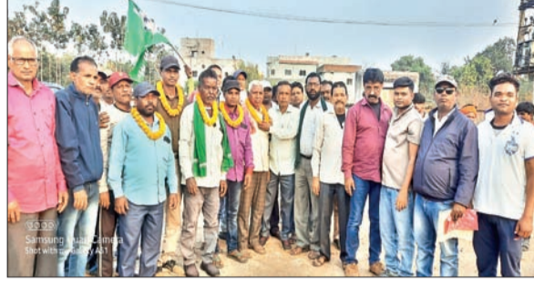
सदस्यता अभियान चलाते झामुमो के पदाधिकारी।