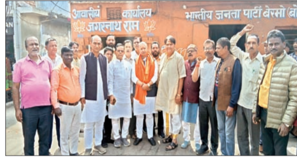
फुसरो में चतरा सांसद कालीचरण सिंह का स्वागत करते भाजपाई।