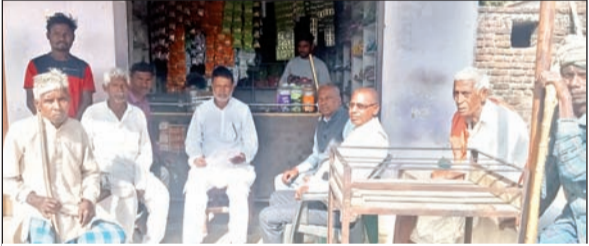
ग्रामीणों से जानकारी लेते जीप सदस्य