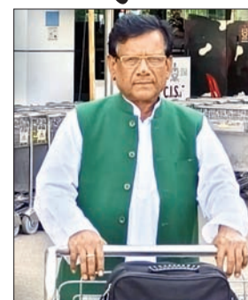
गए हैं। वे उत्तराखंड के देहरादून, मंसूरी में पर्यावरण संरक्षण और

- देहरादून के मंसूरी में पर्यावरण संरक्षण व जलवायु परिवर्तन पर आयोजित अंतरराष्ट्रीय सम्मेलन का करेंगे उद्घाटन