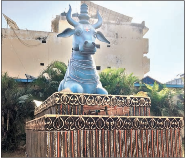
सांस्कृतिक कार्यक्रमों का आयोजन किया जायेगा और लोगों को महाशिवरात्रि के महत्व के बारे में बताया जायेगा। उन्होंने कहा कि इस वर्ष का मुख्य आकर्षण 144 वर्ष बाद हो रहे महाकुंभ के ऊपर