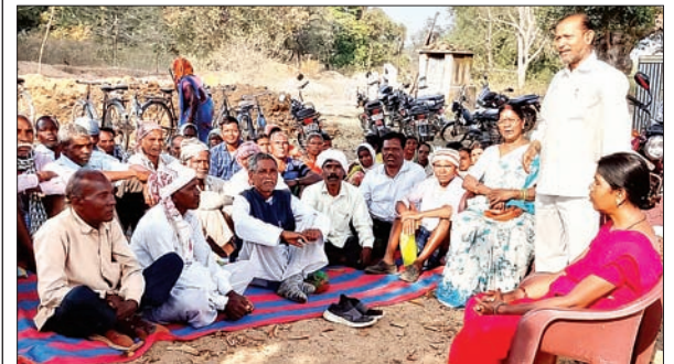
झारखंड आंदोलनकारी मोर्चा के संगठन का विस्तार