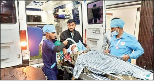
सीआइएसएफ जवान को गोली लगने के बाद अस्पताल में चल रहा इलाज।

धनबाद। जिले के धनसार थाना अंतर्गत बीसीसीएल की विश्वकर्मा प्रोजेक्ट जे पैच कैच में तैनात सीआइएसएफ जवान द्वारा आत्महत्या करने की कोशिश का मामला प्रकाश में आया है। जिसके बाद प्रोजेक्ट में ड्यूटी पर तैनात अन्य सीआइएसएफ जवान और कर्मी मौके पर पहुंचे एवं आनन-फानन में घायल जवान को जोड़पाफाटक स्थित पाटलिपुत्र नर्सिंग होम ले गये। वहां से डॉक्टर