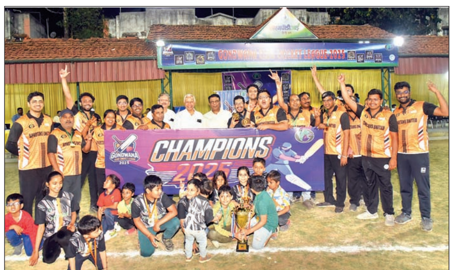
आजाद सिपाही संवाददाता

रांची। सीएमपीडीआइ के खेल मैदान में आयोजित तीन दिवसीय गोंदवाना क्लब क्रिकेट लीग-2025 टूर्नामेंट के फाइनल मैच में स्पार्टस यूनाइटेड का मुकाबला धरा योद्धा के बीच हुआ। स्पार्टस यूनाइटेड ने धरा योद्धा की टीम को 5 विकेट से पराजित कर टीम चैंपियनशिप का खिताब प्राप्त किया।