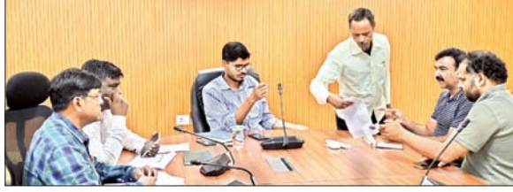
जनता दरबार में लोगों की समस्याएं सुनते एडीएम कानून व्यवस्था।

सत्यापन करने, कार्य में तेजी लाने और योजना के संबंध में