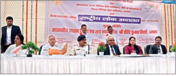
राष्ट्रीय लोक अदालत में उपस्थित डालसा के गणमान्य लोग।

धनबाद। नालसा के निर्देश पर इस साल के पहले राष्ट्रीय लोक अदालत का शनिवार को शुभारंभ हुआ, जिसका उद्घाटन धनबाद के प्रधान जिला एवं सत्र न्यायाधीश सह डालसा के चैयरमैन वीरेंद्र कुमार तिवारी और डीसी सह डालसा के वाइस चैयरमैन माधवी मिश्रा ने किया। इस अवसर पर उन्होंने कहा कि राष्ट्रीय लोक अदालत संविधान की परिकल्पना को पूरी करने की दिशा में एक कदम है। नवंबर 2013 से पूरे देश में राष्ट्रीय लोक अदालत का आयोजन हर तीन महीने में किया जा रहा है। हमारा संविधान हर लोगों को सामाजिक, आर्थिक एवं सस्ता सुलभ न्याय की गारंटी देता है। डीसी माधवी मिश्रा ने कहा कि राष्ट्रीय लोक अदालत आम आदमी के हित के लिये लगाये जाते हैं। बिना