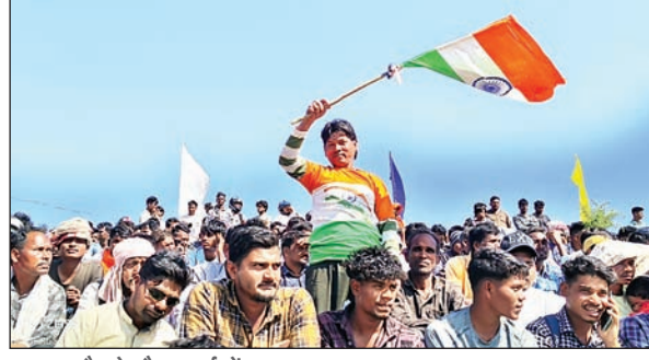
फाइनल मैच के दौरान दर्शकों का उत्साह।

शिवप्रसाद साहू मेमोरियल टी20 टूर्नामेंट : कोलकाता को पराजित कर जेएससीए की टीम बनी चैंपियन