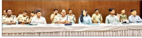
न्यू टाउन हॉल में जिला स्तरीय शांति समिति की बैठक में शामिल डीसी, एसपी एवं अन्य।

हुड़दंगियों की सूचना पुलिस को दें, खुद कोई फैसला ना करें : सिटी एसपी