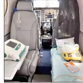
प्रति उड़ान घंटे के दर पर एयर एंबुलेंस की सुविधा दी जाती है।

मरीजों के परिजन नगर विमान विभाग द्वारा संचालित 8210594073 मोबाइल नंबर पर फोन कर एयर एंबुलेंस की सेवा संबंधी जानकारी 24 घंटे किसी भी समय ले सकते हैं। जानकारी के अनुसार झारखंड के बाहर अन्य गंतव्य स्थानों पर मरीजों को ले जाने पर संबंधित व्यक्ति को आवश्यकता पड़ने पर 55,000