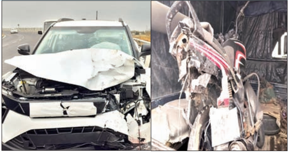
दुर्घटनाग्रस्त कार और बाइक।

अनगड़ा। हेसल टोल प्लाजा के समीप रिंग रोड इन दिनों जानलेवा साबित हो रहा है। पिछले एक पखवारे के अंदर यहां हुई सड़क दुर्घटना में तीन लोगों की जान जा चुकी है। रविवार को भी सुबह टोल प्लाजा के समीप बने ओवरब्रिज में एक तेज रफ्तार कार ने बाईक सवार युवक को टक्कर मार दिया, जिससे उसकी मौत हो गयी। कार के धक्के से बाइक ओवरब्रिज से करीब 30 फीट नीचे सर्विस रोड पर जा गिरी। सरकारी एंबुलेंस सेवा 108 से तत्काल युवक को इलाज के लिए रिम्स अस्पताल ले जाया गया जहां चिकित्सकों ने मृत घोषित कर दिया। जानकारी के मुताबिक बाईक पर सवार युवक हेसल