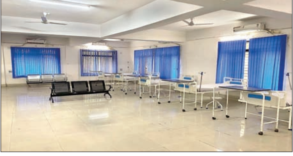
डीएमसीएच में बना छह बेड वाले कीमोथेरेपी सह डे केयर यूनिट।

धनबाद। धनबाद मेडिकल कॉलेज अस्पताल (डीएमसीएच) में सोमवार को कैंसर मरीजों के लिए छह बेड वाले कीमोथेरेपी सह डे केयर यूनिट शुरू किया गया। पीजी ब्लॉक स्थित रेडियोथेरेपी विभाग में स्थापित इस यूनिट का राज्य के स्वास्थ्य मंत्री इरफान अंसारी ने वीडियो कांफ्रेंसिंग के माध्यम से उद्घाटन किया। यह राज्य के किसी भी सरकारी अस्पताल में पहली ऐसी सुविधा है, जिससे कैंसर मरीजों को लाभ मिलेगा। इस डे केयर यूनिट में उन मरीजों को भर्ती किया