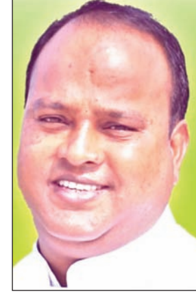
स्वाधीन लोग सिरमटोली फ्लाईओवर को लेकर दिशाविहीन राजनीति कर रहे हैं।

कहा-सीएम हेमंत सोरेन ने पहले ही यह गयोसा दे रखा है कि समस्या का समाधान कर लिया जायेगा, बावजूद आंदोलन क्यों