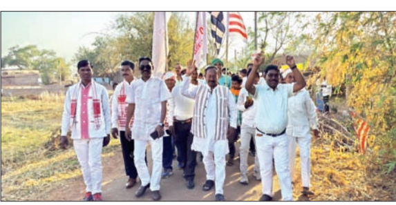
कटरमाली में निकली सरहल की शोभायात्रा में शामिल ग्रामीण।