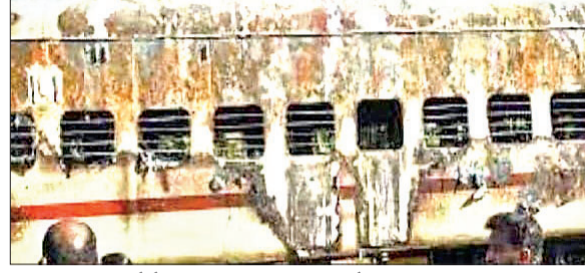
आग लगने के बाद जलकर खाक हुआ कोच।

आजाद सिपाही संवाददाता धनबाद रेल मंडल के नेता जी सुभाष चंद्र बोस जंक्शन गोमो सिक लाइन यार्ड में रविवार को सुबह एक रेल कोच में भीषण आग लग गई। उसकी सूचना मिलने के बाद रेल परिसर में अफरा तफरी मच गयी। इसकी सूचना तुरंत फायर ब्रिगेड को दी गयी। जिसके बाद मौके पर पहुंची फायर ब्रिगेड की गाड़ियों ने आग पर बड़ी मशकत के बाद काबू पाया। आग लगने की घटना जहां घटित हुई वहां अन्य ट्रेन की रोक भी